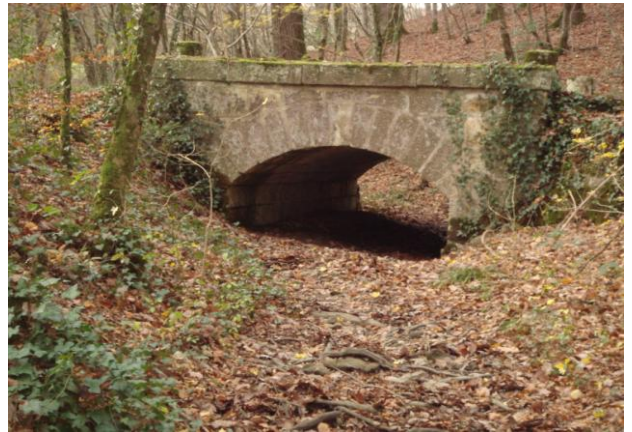
Il est visible à la belle Fontaine de Rochefort toute l'année (image 2)