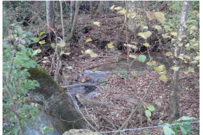
On le retrouve un peu avant la place de Louptière à la Lotière (point 5, plus de place pour des images ! Un jour on fera un spécial images ?)

Une bonne idée pour Papy et Mamie : par mauvais temps confectionnez un moulin à eau ou et un radeau et par grand soleil allez les tester à la fontaine de Rochefort, vous passerez des moments merveilleux avec vos petits bandits !