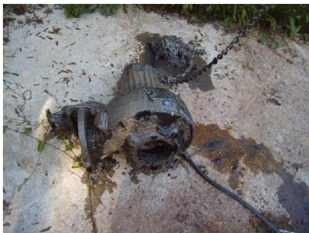
Pompe hors-service et bouchon de lingettes

L'intervention réalisée a valu 4 heures de nettoyage et de contrôle des pompes, démontage et essai de la pompe en panne et remplacement de celle-ci car elle n'a pas survécu, usée par un travail qu'elle n'aurait jamais dû supporter. Ci-dessous quelques photos qui parlent d'elles-mêmes :