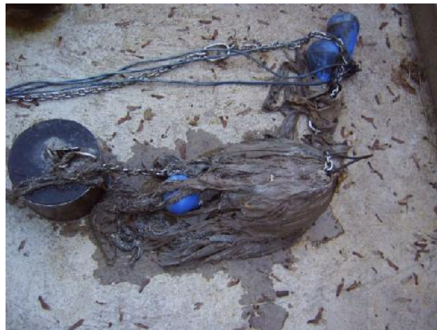
Sondes de niveaux prises dans les lingettes

Cette opération a bien sûr un coût qui s'élève à 8 157, 92 € TTC . Et le coût de ce service, qui augmentera si l'on continue à jeter les lingettes dans les toilettes, aura un impact au final sur nos factures d'eau.